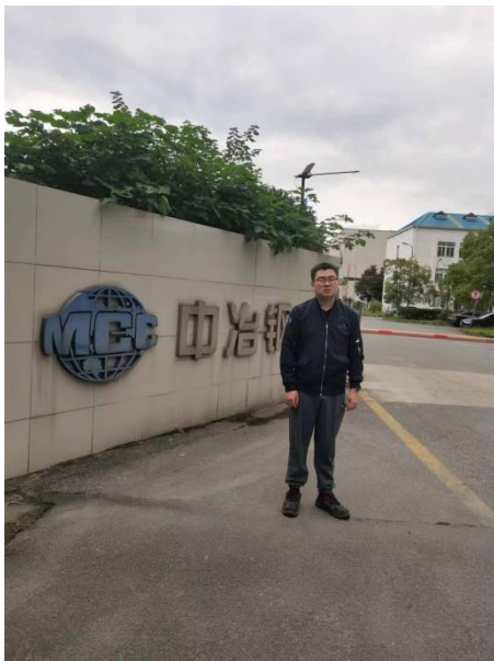
现场调查、现场采样、现场检测照片