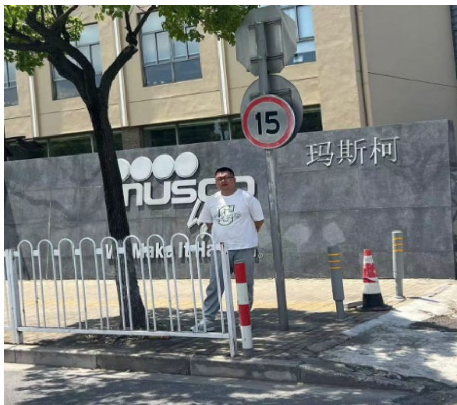
现场调查、现场采样、现场检测照片