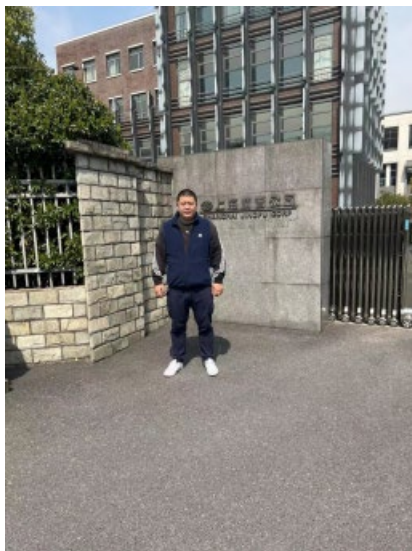
现场调查、现场采样、现场检测照片