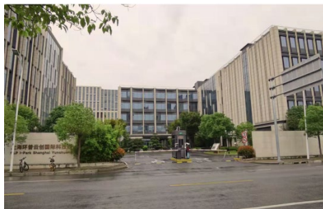
西一上海环普云创国际科技园办公楼